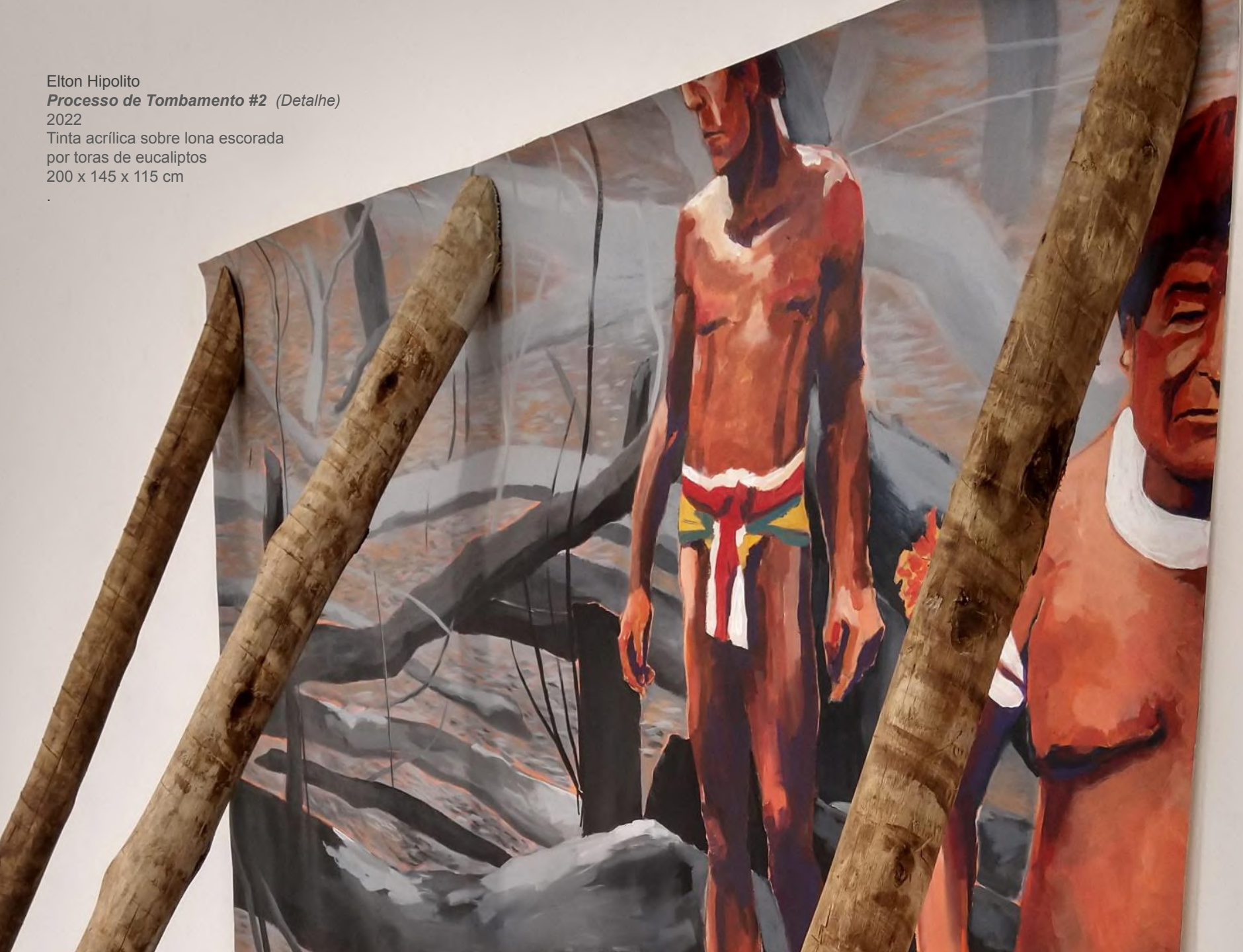
Elton Hipolito Processo de Tombamento #2 (Detalhe) 2022 Tinta acrílica sobre lona escorada por toras de eucaliptos 200 x 145 x 115 cm