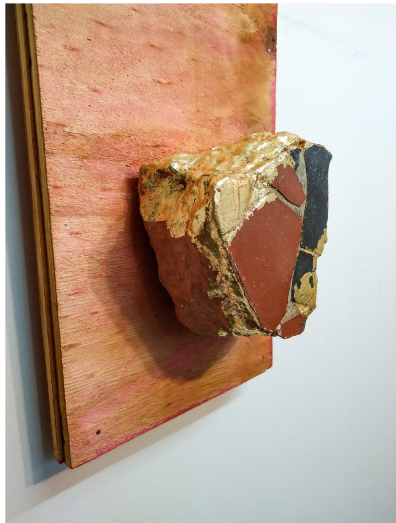
Elton Hipolito s/ título # 2, da série Fato Consumado. 2021 Escombros com azulejos coletado em demolição folheado a ouro (falsa) sobre tapume 54,9 x 20 x 8,5 cm Coleção Particular