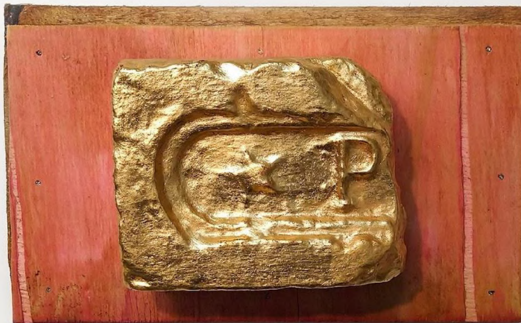
Elton Hipolito. s/ título # 1, da série Fato Consumado . 2021 Tijolo coletado em demolição com folha de ouro (falsa) sobre tapume. 19 x 31 x 11 cm Coleção Particular