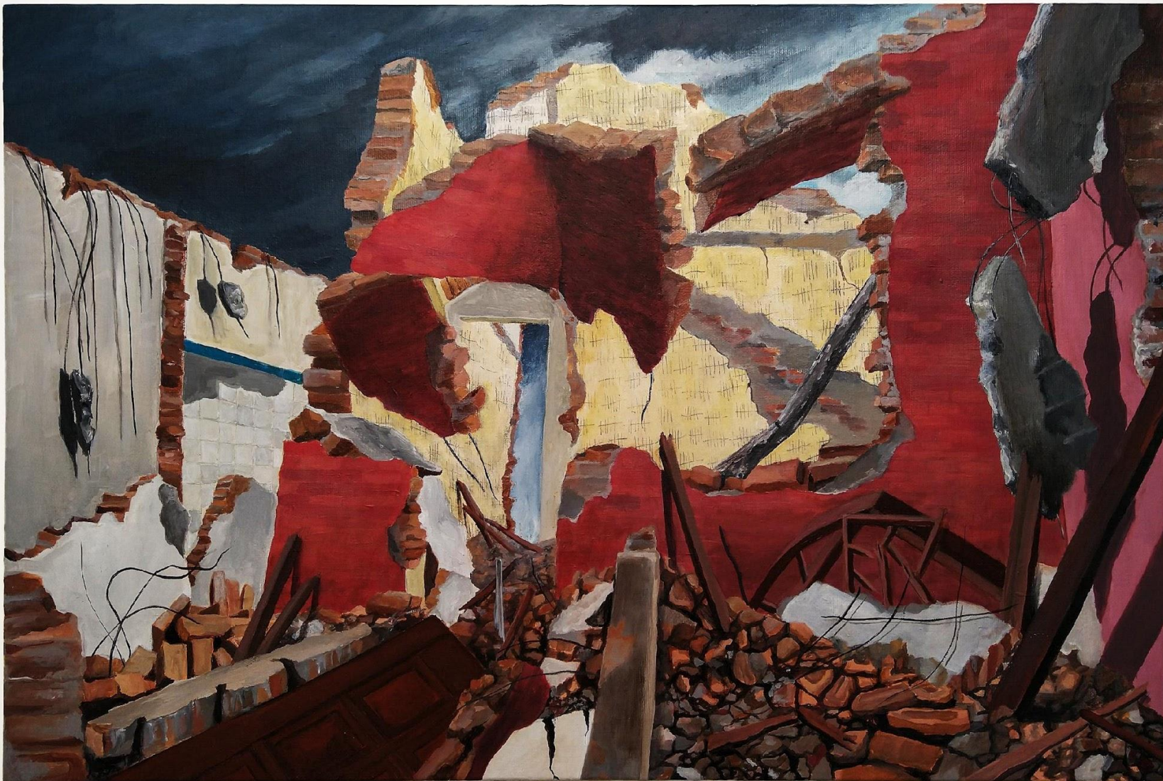
Elton Hipolito. Antes que a sua paranoia... 2021. Da série (In) Rupturas . Tinta acrílica e lápis grafite s/ tela. 40 x 60 cm