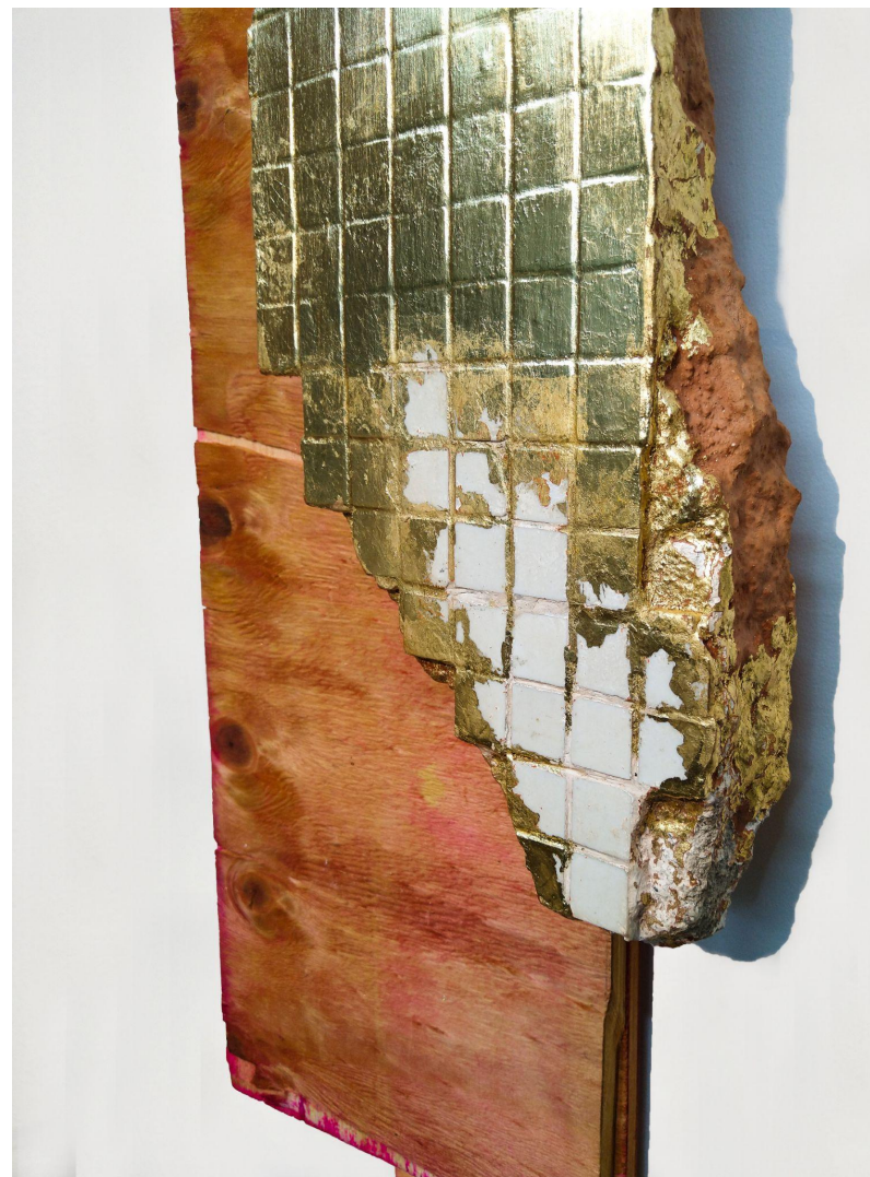
Elton Hipolito s/ título # 3, da série Fato Consumado . 2021 Escombro com azulejos coletado em demolição folheado a ouro (falsa) sobre tapume 55 x 26 x 7 cm Coleção particular