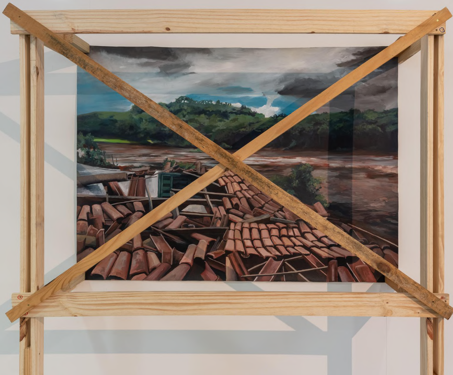
Elton Hipolito. Processo de Tombamento # 4 [ Brumadinho ] . 2023. Tinta acrílica sobre tecido e escoras de madeira. 200 x 160 x 52 cm.