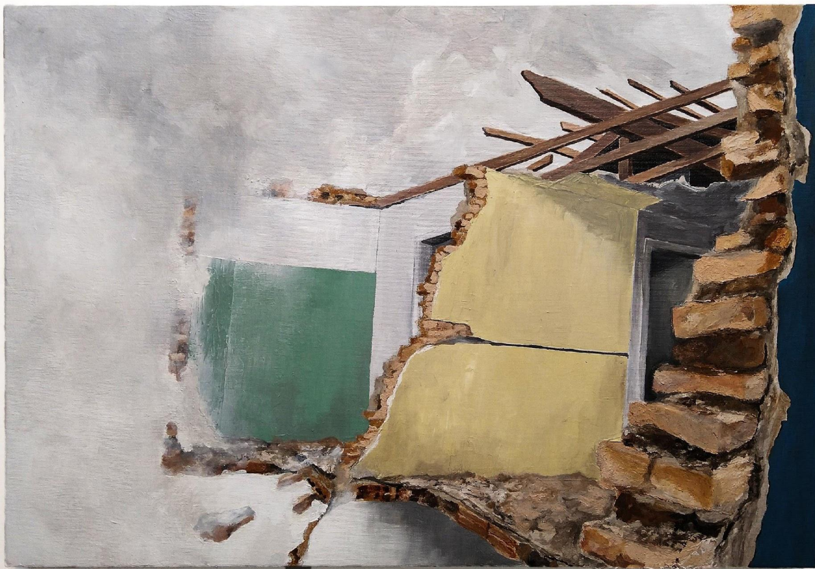
Elton Hipolito. O preço de nossas escolhas...2022 . Da série (In) Rupturas . Tinta acrílica e tinta preparada com tijolos coletados em demolição s/ tela. 40 x 60 cm.