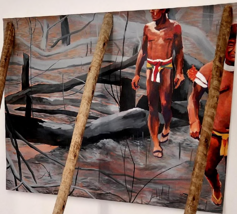
Elton Hipolito Processo de Tombamento #2 [ Amazônia em Chamas ] 2022 Tinta acrílica sobre lona escorada por toras de eucaliptos 200 x 145 x 115 cm