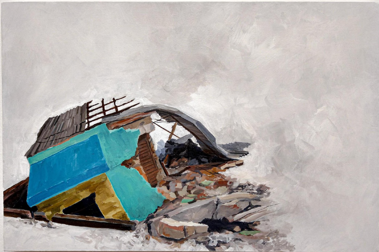
Elton Hipolito. Delírio Patriota... 2022. Da série (In) Rupturas . Tinta acrílica s/ tela. 40 x 60 cm