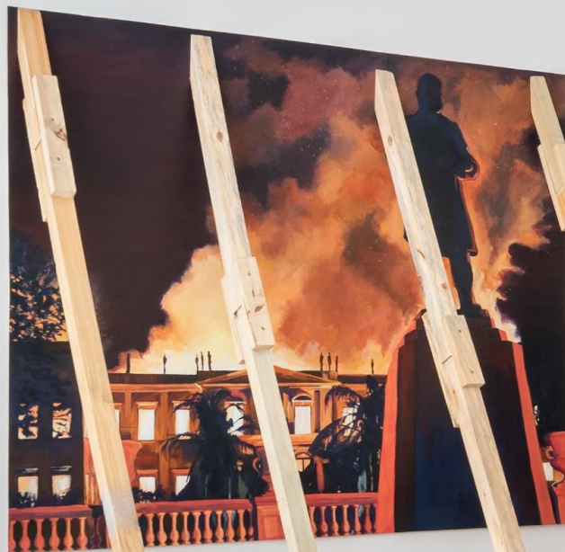
Elton Hipolito Processo de Tombamento #1 [ Museu Nacional ] 2022 Tinta acrílica sobre lona escorada por caibros de madeira 200 x 140 x 100 cm