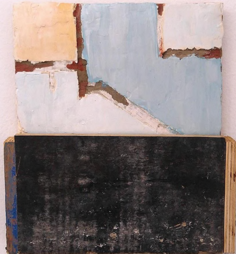
Elton Hipolito Sobre o pedaço de algum lugar # 8 2022 Tinta acrílica sobre cimenticola, massa corrida e tapume 37 x 33,5 x 5 cm